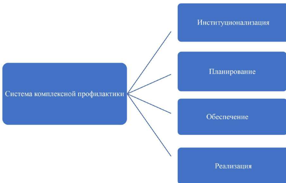
Рис. 2. Система комплексной антитеррористической профилактики

Целью настоящих методических рекомендаций является формирование и совершенствование комплексной работы по профилактике идеологии терроризма и экстремизма среди молодежи через призму ситуационного подхода, предполагающего своевременное, адресное и рациональное использование различных форм профилактического воздействия (рис. 2).