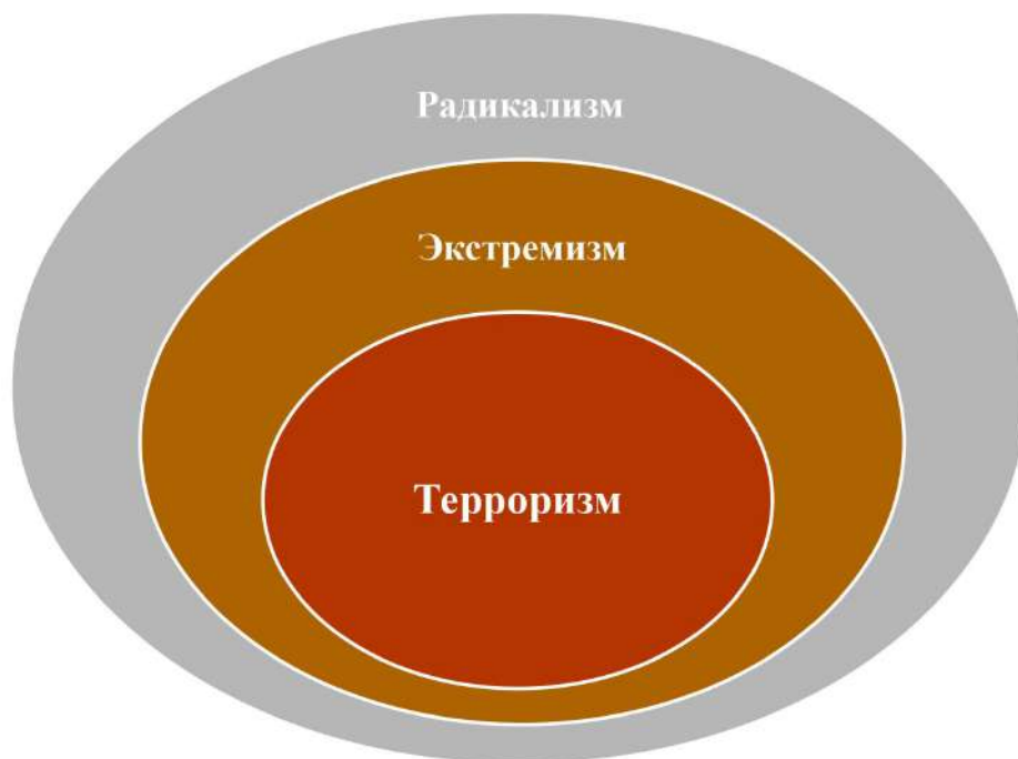
Рис. 3. Соотношение категорий терроризма, экстремизма и радикализма через призму кругов Эйлера