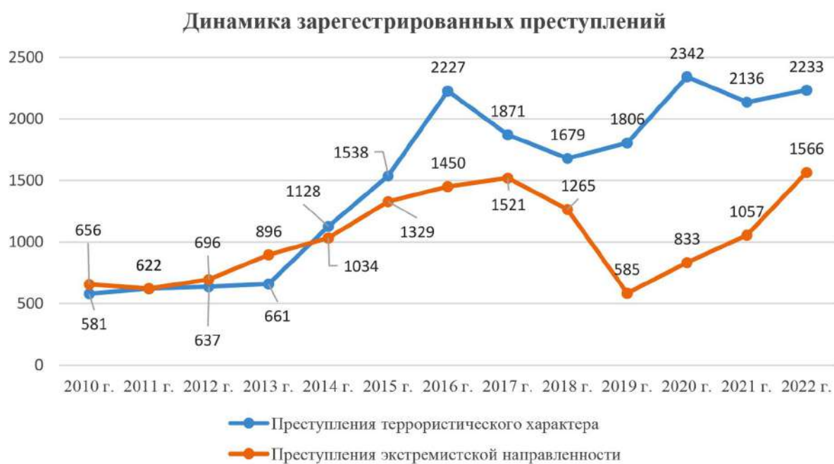
Рис. 1. Динамика преступлений экстремистской и террористической направленности

В этой связи одной из приоритетных задач, стоящих как перед государственными органами, так и перед научным сообществом, является выработка эффективных мер по организации и проведению комплексной работы в области профилактики радикализации российской молодежи и недопущения инспири-