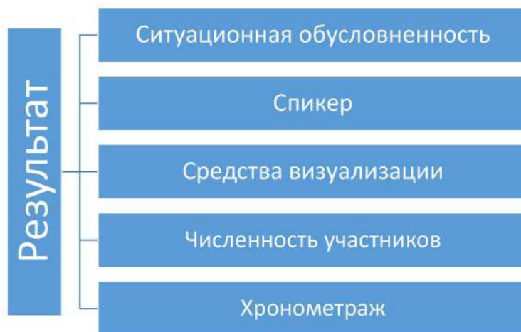
Рис. 5. Факторы результативности вербальных профилактических мероприятий

Применительно к временным показателям проведения мероприятий оптимальным представляется хронометраж 90 минут, поскольку более длительное мероприятие непременно будет терять зрительский интерес. Также не рекомендуется проводить мероприятия в субботние дни, так как для большинства молодых людей этот день недели является выходным. Основные факторы, влияющие на результативность профилактических мероприятий, представлены на рисунке 5.