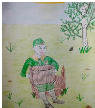
Никитина Елизавета (рисунок по мотивам песни «Тальяночка»)