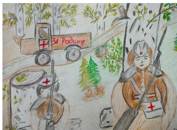
Алиев Руслан (рисунок по мотивам песни «Соловьи»)