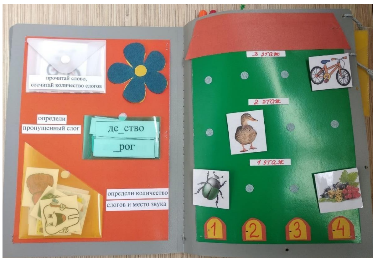
Рис.2. Задания на звуковой и слоговой анализ и синтез