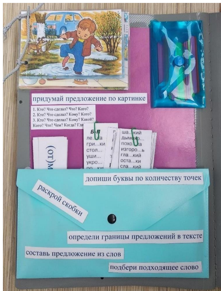
Рис.3. Задания на языковой анализ и синтез на уровне предложений и текста