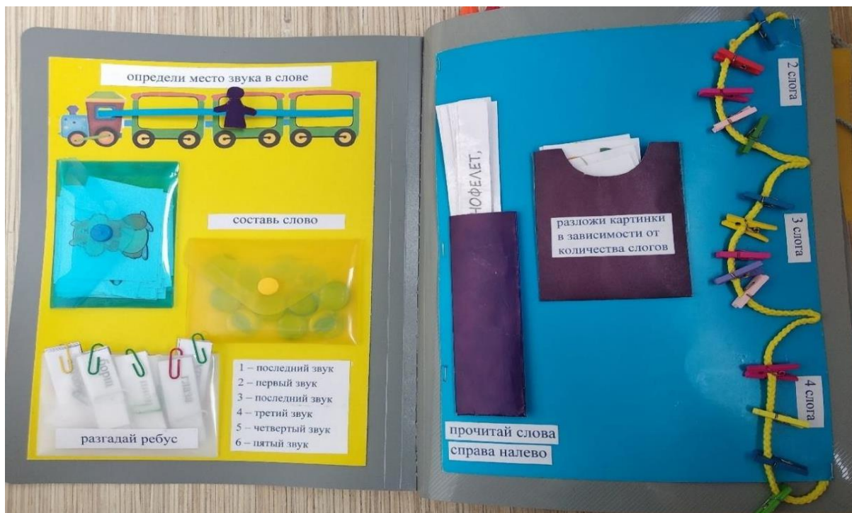
Рис.1. Задания на звуковой и слоговой анализ и синтез