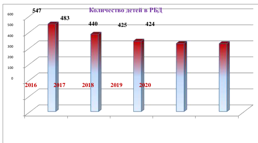
Диаграмма № 2 Количество детей, усыновленных российскими гражданами, уменьшилось на 5 человек, а усыновленных иностранными гражданами уменьшилось на 2 ребенка (диаграмма №3).

Так, на 01.01.2020 в РБД о детях стоят на учете 424 ребенка (на 01.01.2019 – 425 детей; на 01.01.2018 – 440 детей; на 01.01.2017 – 483 ребенка, на 01.01.2016 – 547 детей), оставшихся без попечения родителей (диаграмма № 2).